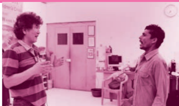
「アングリーバードとバナナ合唱団」アジアンドキュメンタリース配信作品

2016年/韓国・インド/87分/ドキュメンタリー/ヒンディー語、韓国語、英語 監督：ジュー・ヘウォン 出演：キム・チェチャン 配給：アジアンドキュメンタリース