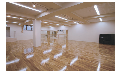
練習スタジオ ■面積 152㎡ ■定員 60人