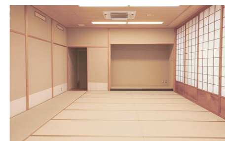
和室 ■面積 25畳 ■定員 32人