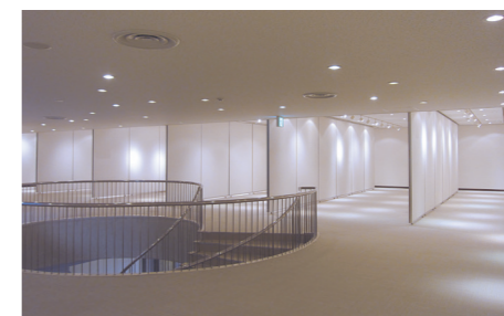
展示ギャラリー ■面積 367㎡ ■定員 会議使用180人