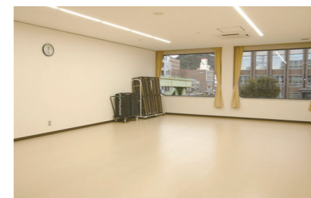
多目的ルームA・B ■面積 各75㎡ ■定員 各48人