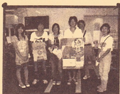
岐阜大学地域科学部の学生さん達と ポスター貼りへ！