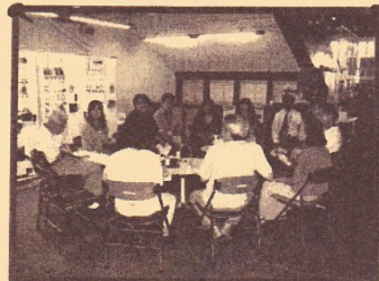
映画「東京オリンピック」終了後の座談会

今年で30回を迎える「ぎふアジア映画祭」ではアジアの枠を超えてさまざまな国の作品を定期的に上映していこうと新たな試みとして「グットシアター2008」を企画し「GOOD」ではなく「ぐっとくる」映画4本を選びました。