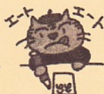
イラスト G-free・michiko hayashi