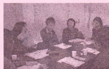
▲ C班 脚本作り