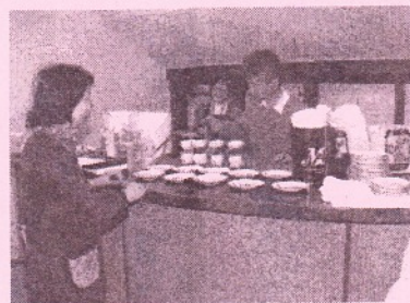
▼ 名物 石樽さんのコーヒー