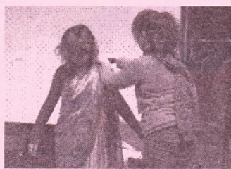
▲ インド企画 サリー体験

映画上映の他に、ゲストトークとして『ジュウブンノキュウ』の脚本家で岐阜市出身のなるせゆうせい氏をお招きしてのトーク、また『幸福のスイッチ』ゲストトークには、安田真奈監督をお招きしての対談を行いました。