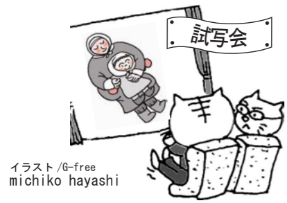
イラスト/G-free michiko hayashi

ぎふアジア映画祭・グットシアターと、映画上映会を催すときの大切な仕事のひとつに“作品選定”があります。多くのお客様を対象にする映画の選定、容易そうにみえてそれはもう幾多の困難（！）と、そして情熱の嵐が渾然となる会議が、映画祭が終幕した翌週から次の映画祭チラシ作りが始まる5月頃までほぼ毎週のように行われます。当然ながら「この映画が好きだ、面白い」それだけでは決められません。選定人の嗜好も様々、