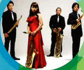
アリオンサクソフォンカルテット