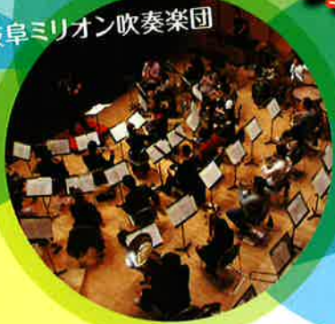
岐阜ミリオン吹奏楽団