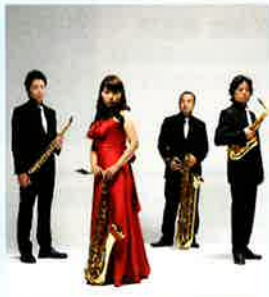
アリオンサクソフォンカルテット

<受賞歴>2007年度「岐阜市芸術文化奨励賞」受賞。 2011年度「東久邇宮文化褒賞」受賞。